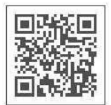
書類ダウンロード

もしくは右のQRコードを読み取り、「あじさいネット利用者登録申請書（個人・団体B）」と口座振替依頼書（個人・団体B）」のデータを印刷してください。